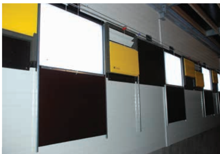
Flash 3300 ventiel