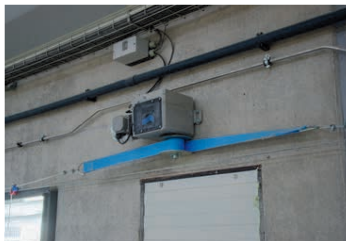
Liermotor TW 150

Tulderhof Ventilation BV • Looyenbeemd 10 • 5652 BH Eindhoven • Nederland Tel. +31 (0) 40 400 63 13 • Fax +32 (0) 14 65 99 60